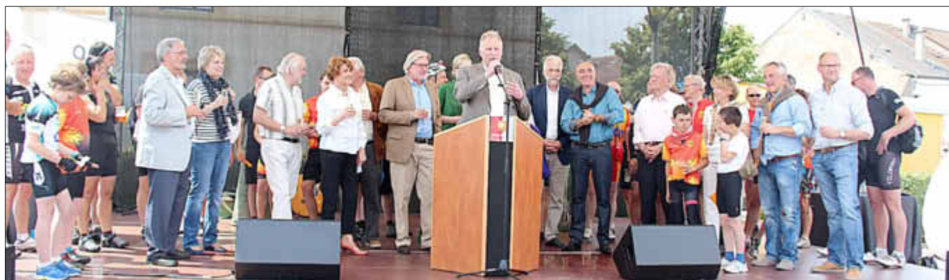
Offizielle Begrüßung durch die Bürgermeister und Vertreter der Gepaco-Kommunen

Alles in allem ein gelungenes Fest, das nach einhelliger Meinung aller Beteiligten im nächsten Jahr eine Neuauflage in einer der anderen Teilnehmerkommunen erfahren soll.