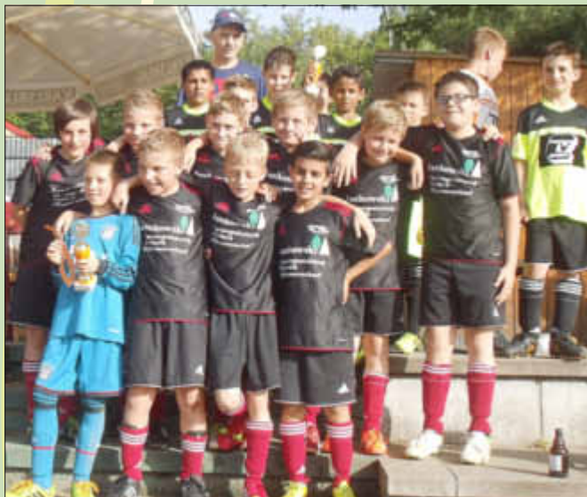
Die E 1-Juniorinnen der SG Scheiden-Mitlosheim (im Bild vorne), 3. Platz beim SFV-E-Jugend-Cup Landesentscheid, holten auch den Gemeindepokal. Im Hintergrund der Finalgegner, das Team der ausrichtenden SF Bachem-Rimlingen

Wir bedanken uns bei den SF Bachem-Rimlingen mit ihren Helfern, bei den Sponsoren, bei den Zuschauern, bei den Schiedsrichtern und bei den Mannschaften (Spieler, Trainer und Betreuer), die alle zum Gelingen der Veranstaltung beigetragen haben.