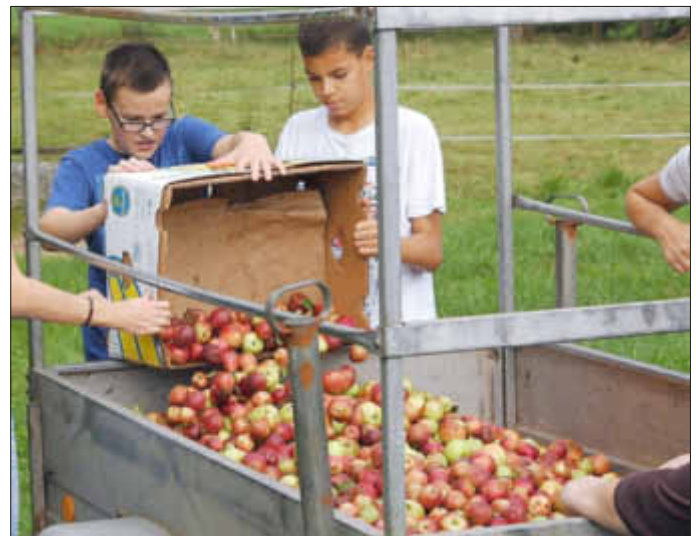
Schüler der PDG Losheim bei der Apfelernte in Niederlosheim

Vom Baum in die Flasche - Schüler der PDG Losheim stellen eigenen Apfelsaft her