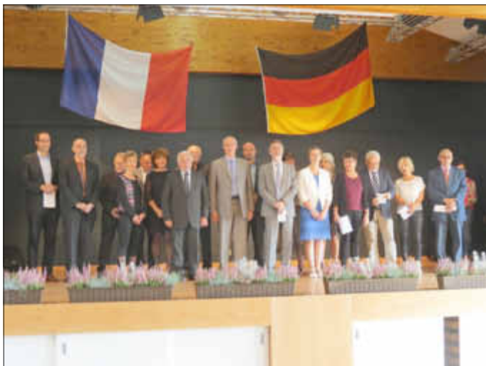
Die offiziellen Repräsentanten der beiden Partnerkommunen und der Partnerschaftsvereine stimmen in die Nationalhymnen ein.