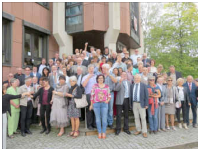
„Ein Prosit auf die Jumelage und das neue Partnerschaftsbild!“ - Die französische Delegation und ihre Gastgeber vorm Rathaus.

Insgesamt gestaltete sich der Jubiläumsbesuch sehr erfolgreich und setzte neue Impulse für den künftigen Partnerschaftsaustausch. Beim Abschied freuten sich sowohl die französischen Gäste als auch ihre Gastgeber auf ein Wiedersehen im kommenden Jahr in La Croix Saint Ouen.