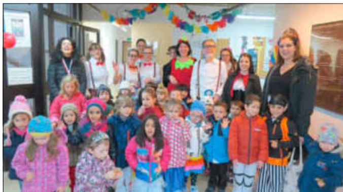
Auch die Kinder der Kita Villa Regenbogen stimmten das Rathaus auf eine närrische Fastnacht ein