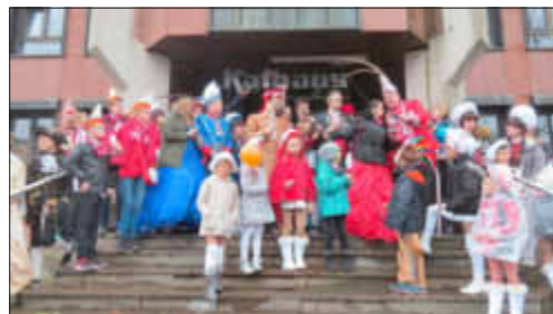
Losheimer Rathäuserstürmung am Fetten Donnerstag