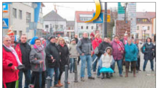
Zuschauer der Rathäuserstürmung