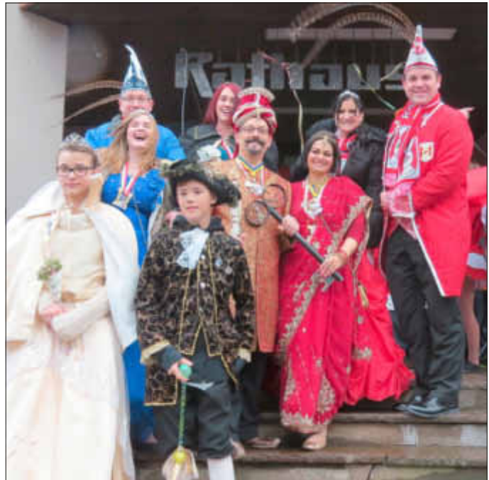
Machtübernahme durch die Pinzenpaare der Gemeinde