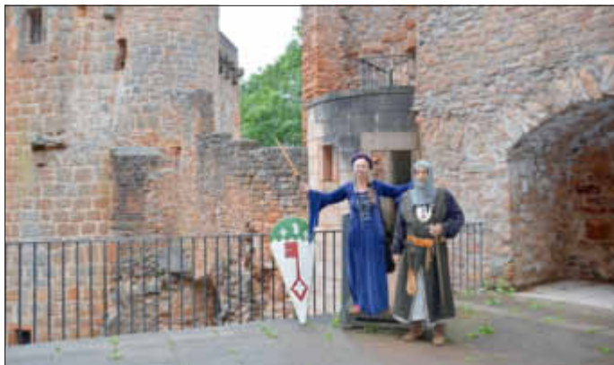
Ritter „Guy de Montclair“ und seine Burgdame erzählen spannende Geschichten über die Burg Montclair

Informationen und Burgbistro, telefonisch (0 68 61) 80-235 zu den Öffnungszeiten der Burg; Gastronomie: E-Mail an gastroonomie@burg-montclair.de , Besucherservice: E-Mail an info@burg-montclair.de . Im Internet: www.burg-montclair.de