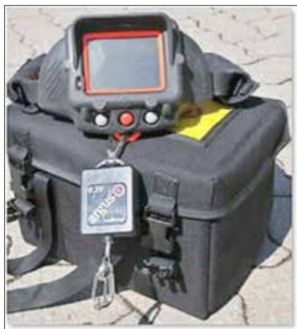
Die neue Wärmebildkamera der Freiwilligen Feuerwehr Britten

„Die Einsatzmöglichkeiten dieser Kamera beschränken sich jedoch nicht nur auf den klassischen Brandeinsatz“, so Löschbezirksführer Klauck. „Bei einem Verkehrsunfall zum Beispiel lässt sich feststellen, auf welchem Sitz eine Person im Auto gesessen hat. Falls also eine beteiligte Person unter Schock das Unfallfahrzeug verlassen hat, kann dies mit Hilfe der Kamera festgestellt und eine schnelle Suche eingeleitet werden.“