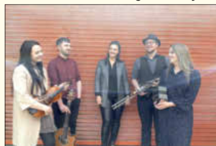
3 on the Bund - Irish Heartbeat 2021