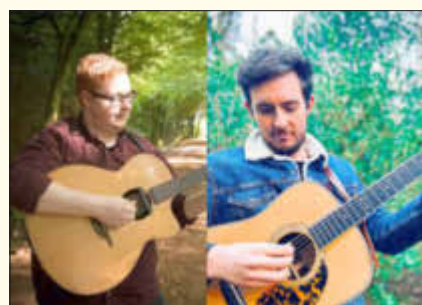
Briste Irish Heartbeat 2020

Am 29. März 2022 dürfen sich alle Liebhaber und Fans der „Grünen Insel“ auf einen musikalischen Leckerbissen freuen. Drei irische, brillante Formationen sind in der Eisenbahnhalle Losheim zu Gast und zelebrieren die musikalische Lebensfreude ihrer Nation. Traditionell und doch quicklebendig sind die Klänge, die die Menschen auf der ganzen Welt schon seit Jahrzehnten mitreißen. Voller Energie präsentieren die Musiker sowohl alte musikalische Wurzeln als auch neue musikalische Brücken, die sich im Laufe der Jahre herausgebildet haben. Tickets für dieses besondere Konzerterlebnis gibt es in allen Ticket Regional Vorverkaufsstellen, im Ticket-Büro der Villa Fuchs in der Stadthalle Merzig und unter 06861/93670. Eine Veranstaltung des Kreiskulturzentrums Villa Fuchs in Zusammenarbeit mit der Gemeinde Losheim am See.