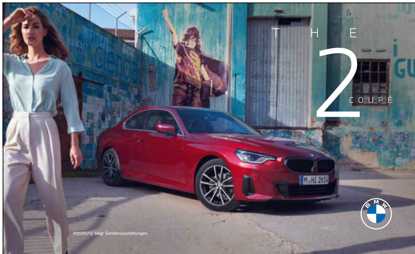
Abbildung zeigt Sonderausstattungen.