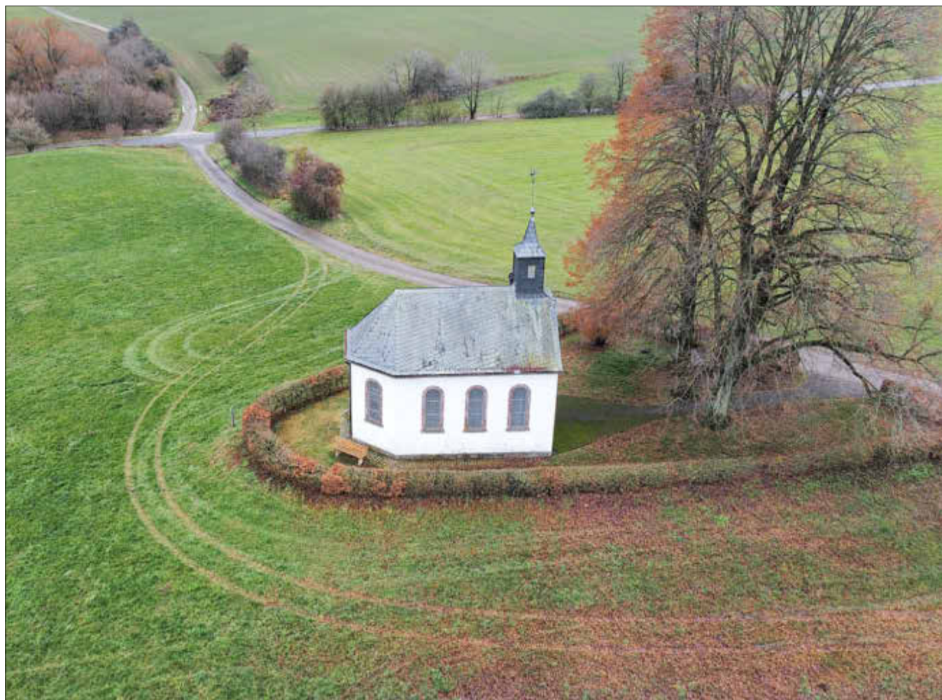
Urwahlener Kapelle von oben